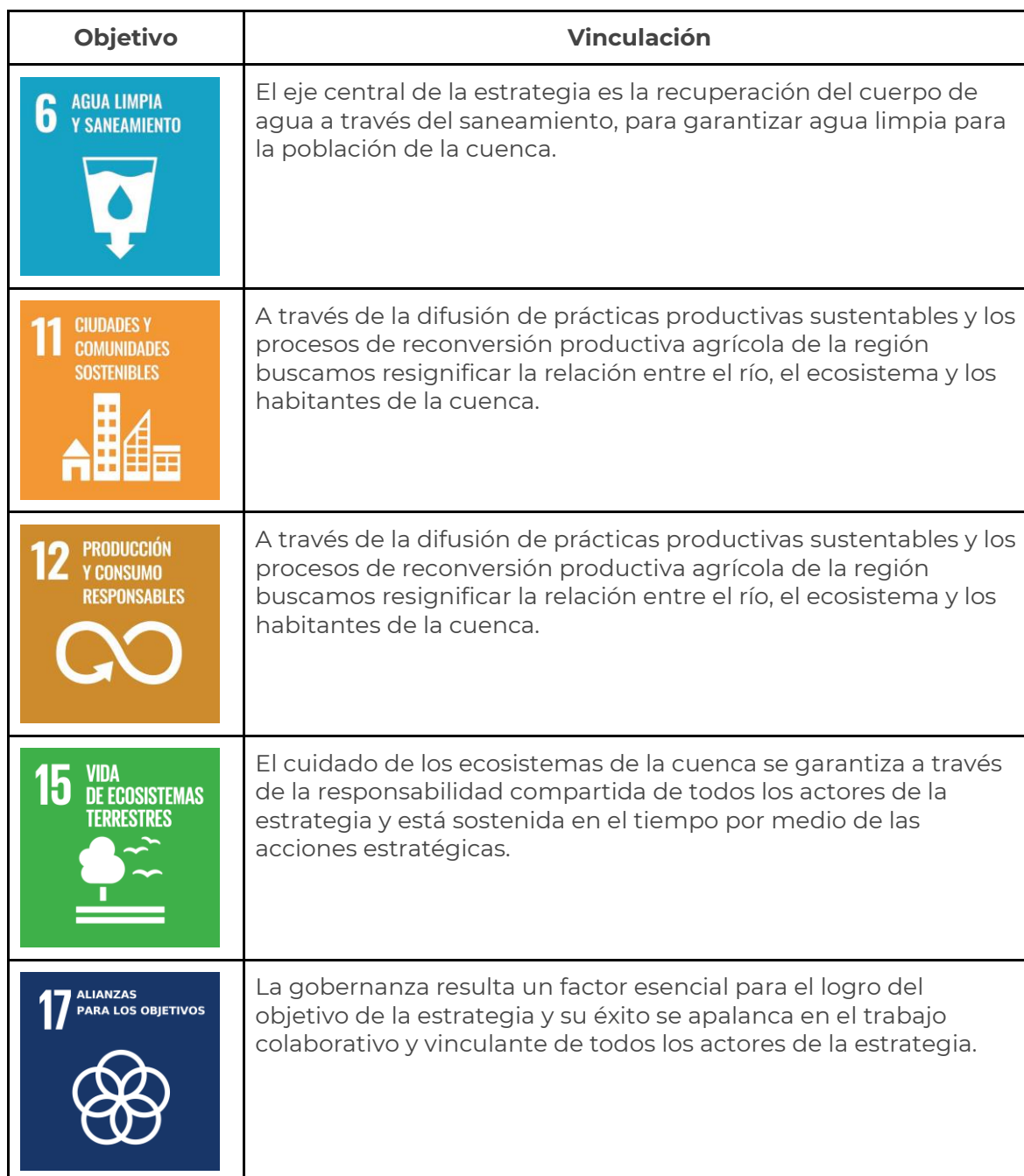
Tabla 4. Los ODS's y su relación con la recuperación integral del río Santiago