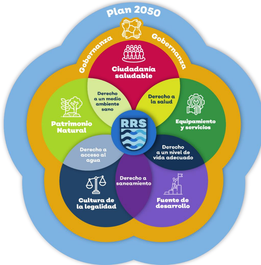
Figura 1. Estrategia integral de recuperación del Río Santiago

Los componentes anteriormente mencionados trabajan de forma articulada al interior de la Estrategia por medio de planes de trabajo vinculantes con acciones precisas establecidas en el corto, mediano y largo plazo según su naturaleza para garantizar la recuperación del río y el bienestar de la ciudadanía jalisciense con una visión objetivo de cara al 2050.